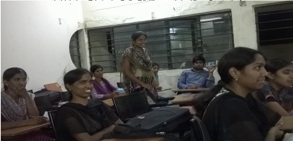
సందేహాలను నివృత్తి చేసుకుంటున్న విద్యార్థులు